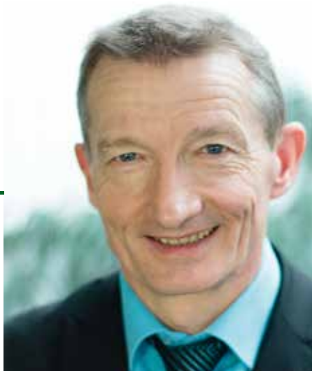
Jean Francois Caron, starosta Loos-en-Gohelle (Francie)

Příklad : od roku 2000 jsem dával na vědomí svou averzi k elektrickému vytápění, této zhoubné francouzské módě. A tak projektoví lídři, sponzoři, kteří chtěli stavět v „obci“, prezentovali projekty motivované investičními náklady, provozem, klimatickou stopou, výběrem materiálů. Legálně jsem nemohl zakázat elektrické vytápění, ale byl jsem schopen podělit se o své obavy nepřidávat energetickou chudobu k ekonomické nejistotě, způsobené vysokými náklady vytápění ve Francii.