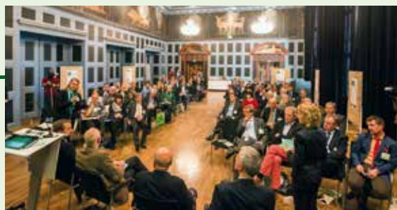
Kassel, 2014 - Vyroční kongres 100% OZE regionů