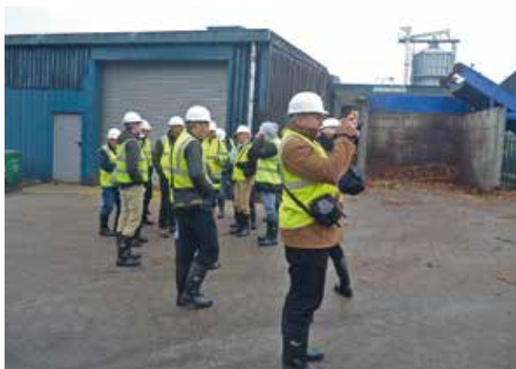
Madarští návštěvníci ve Skotsku

K výměně obcím napomáhá několik nástrojů. Twinningové (dvoustranné) operace jim pomáhají