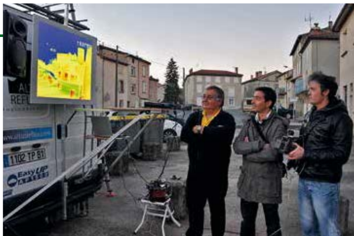
Pojízdná termografie: inovativní systém dobře adaptovatelný ve vesnicích (Francie)

K získání štítku CEMR je nutné založení energetického týmu. Ten by měl zahrnovat 5 až 15 osob včetně starostů, poradců z oblasti energetiky a životního prostředí, zástupců obecních administrativ, místních podnikatelů, zainteresovaných občanů a energetického manažera. Předseda by měl být zvolen na politické úrovni, pravděpodobně starosta, kterému po technické stránce asistuje energetický manažer, expert a řídicí síla ... Každý člen energetického týmu je zodpovědný za určitý sektor (OZE, energetická účinnost, doprava, informování veřejnosti, účast občanů, zahrnující školy