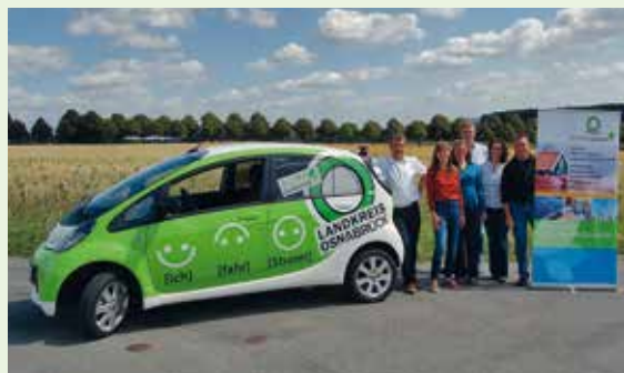
Opatření pro dopravu šetrnou ke klimatu, německý „Hlavní plán 100% ochrany klimatu“

jako město a okres Osnabrück, nebo okres Steinfurt a město Rheine. Oba se účastní německého projektu „Hlavní plán 100% ochrany klimatu“. Jeho cílem je ukázat, jak města ve spolupráci se sousedními územími mohou do roku 2050 ve srovnání s rokem 1990 úspěšně snížit uhlíkové emise o 95% a svou energetickou spotřebu o 50%.