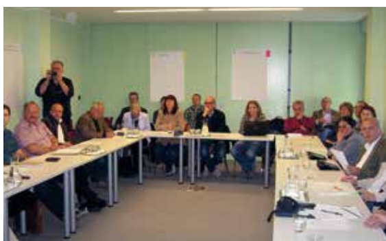
Pracovní seminář, Mirna Valley (Slovinsko)

K dosažení svého cíle musíme postupovat krok za krokem, začít tím prvním, kterým je mobilizace dovedností a zdrojů.