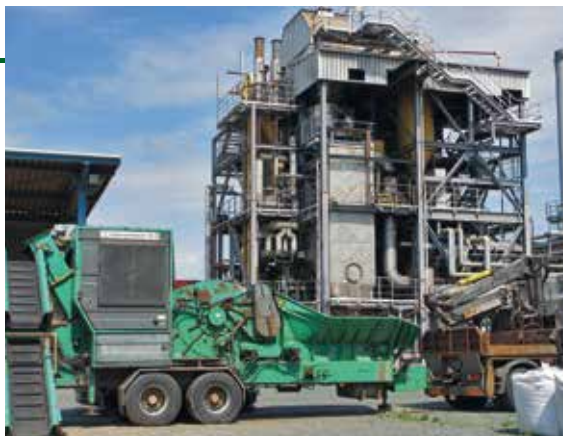
Biomasová výtopna, Güssing (Rakousko)

Během dvou následujících dekád vyrostly tři centrální výtopny na biomasu, dvě bioplynové stanice a mnoho dalších decentralizovaných projektů na využití solární energie. V roce 2014 dosáhl stupeň energetické nezávislosti 75%. V malém městě vzniklo 1 200 nových pracovních míst a 55 firem.