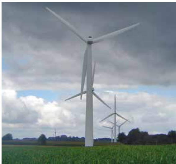
Občanský větrný park, Le Mené (Francie)