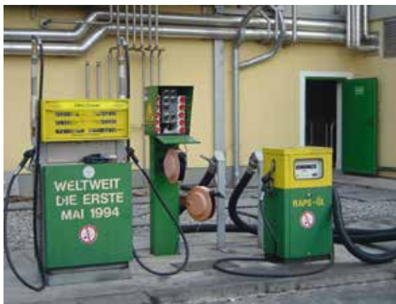
Bionaftová stanice, Güssing (Rakousko)