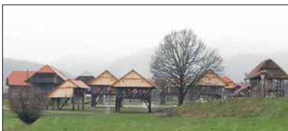
Energie, poslední využití dřeva, konstrukce je první

V říjnu 2006 zorganizovala Asociace vlastníků lesů v Mirna Valley ve spolupráci se slovinským E-forem veřejné konzultace k propagaci využití biomasy k energetickým účelům. Přítomny byly všechny