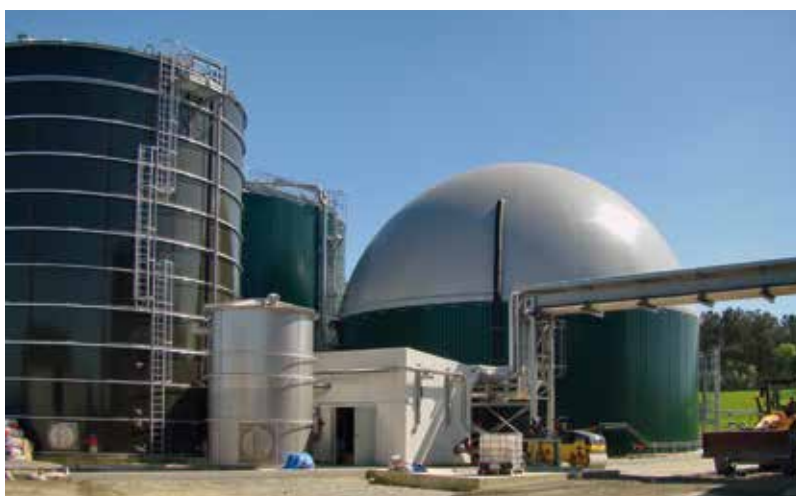
Územní a společná bioplynová jednotka, Le Mené (Francie)