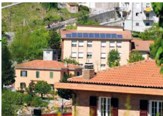
Fotovoltaický systém na veřejné budově (Itálie)

Porota se zapojuje tam, kde se náhradou zdrojů řeší v soukromém i veřejném sektoru snížení emisí skleníkových plynů, a do tvorby akčního plánu.