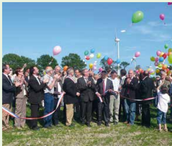
Inaugurace občanského větrného parku Landes du Mené (Francie)

S pomocí národních a regionálních fondů bylo vytvořeno více než 30 udržitelných pracovních míst v energetice.