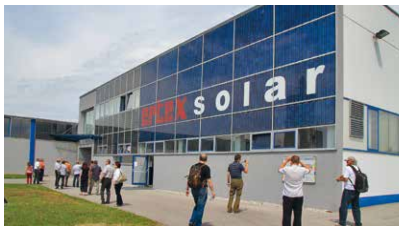
Čeští účastníci druhé studijní cesty v Amstettenu (Rakousko)

Je naprosto nezbytné další vzdělávání volených úředníků a techniků. Zvědavost není špatná věc, právě naopak.