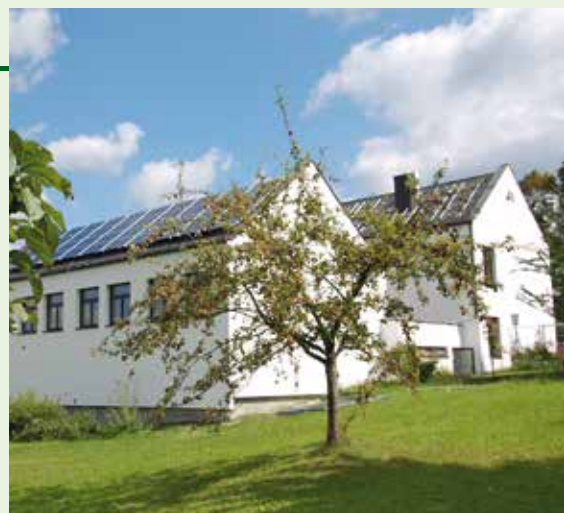
Tepelná izolace školy v Albrechtsbergu (Rakousko)

Model tepelně izolovaných škol vyvinutý v Rakousku odlišuje sám sebe od „normální“ tepelné izolace díky vyšší konečné úspoře energie a snížení CO 2 . Realizují se instalace OZE a používá se ekologický stavební materiál. Dále jsou brány v úvahu sociální cíle, jako je větší pohodlí nebo vyšší kvalita života. Modelová tepelná izolace by měla být opakovatelná v jiných obcích. Modelová tepelná izolace 11 škol v hodnotě 4,4 mil EUR byla financována rakouským Klimatickým a energetickým fondem v roce 2013. Financování je limitováno 50% celkových nákladů, resp. částkou 600 000 EUR na projekt.