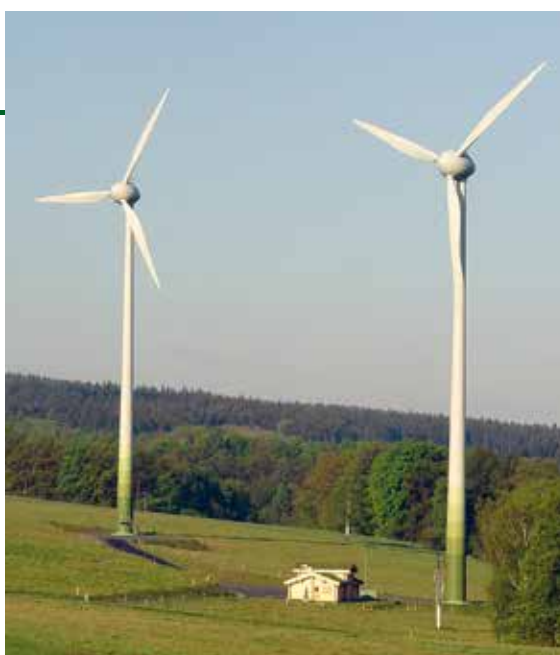
Informační centrum u paty větrné elektrárny (Česká republika)