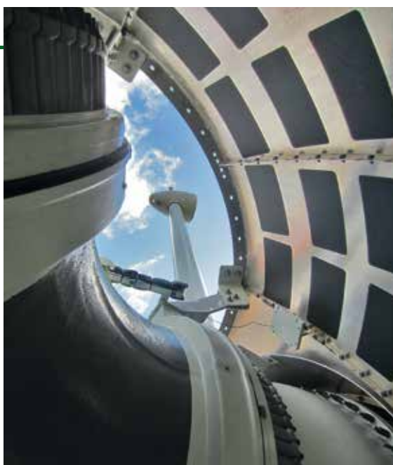
Realizace větrné turbíny, projekt PSDT (Skotsko)

Celkem získala komunita 15 milionů liber na projekt o 9 MW, který se skládá ze tří turbin Enercon. Jsou 145 m vysoké, situované v Beinn Ghrideag na ostrově Lewis. Předpokládaný generovaný příjem by měl