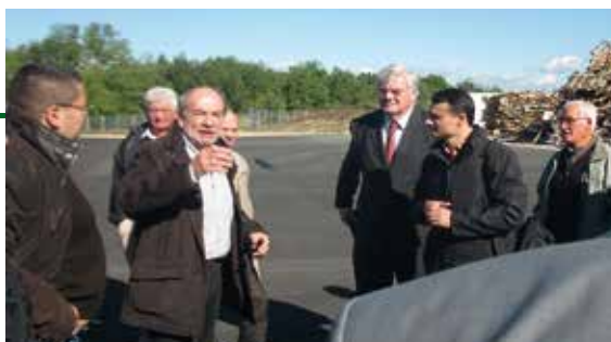
Školení v oblasti biomasy, projekt 100% OZE komunity (Francie)

Druhý - energetický poradce - poskytuje občanům objektivní rady nezávisle na soukromých společnostech a dodavatelích energie.