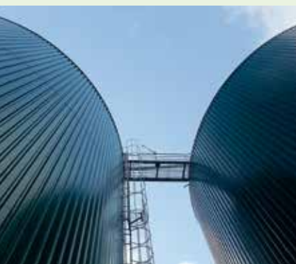
Bioplynová digestoř (Francie)

Kromě definice místní energetické strategie, jejímž nástrojem je společný SEAP, existují dvě dimenze akcí: zprvle projekty rozsáhlého územního zájmu (obecní větrné projekty, kolektivní biplynová jednotka, síť centrálního zásobování teplem na bázi dřeva...) a zadruhé územní animační akce, spočívající v násobných instalacích projektů malého rozsahu (FV na střeších bytových domů a farem, zateplení privátních objektů...). Příklady: