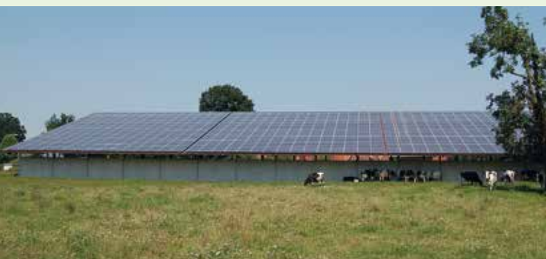
Solární farma, Osnabrück (Německo)

100% OZE komunita je ochotná a schopná kompletně pokrýt svou potřebu energie (elektřinu, teplo, dopravu), případně vyrobit i více. Komunita řeší úsporu energie a energetickou účinnost holistickým a udržitelným způsobem. Podporuje takové cesty rozvoje, jejichž cílem je maximalizace tvorby regionálních hodnot.